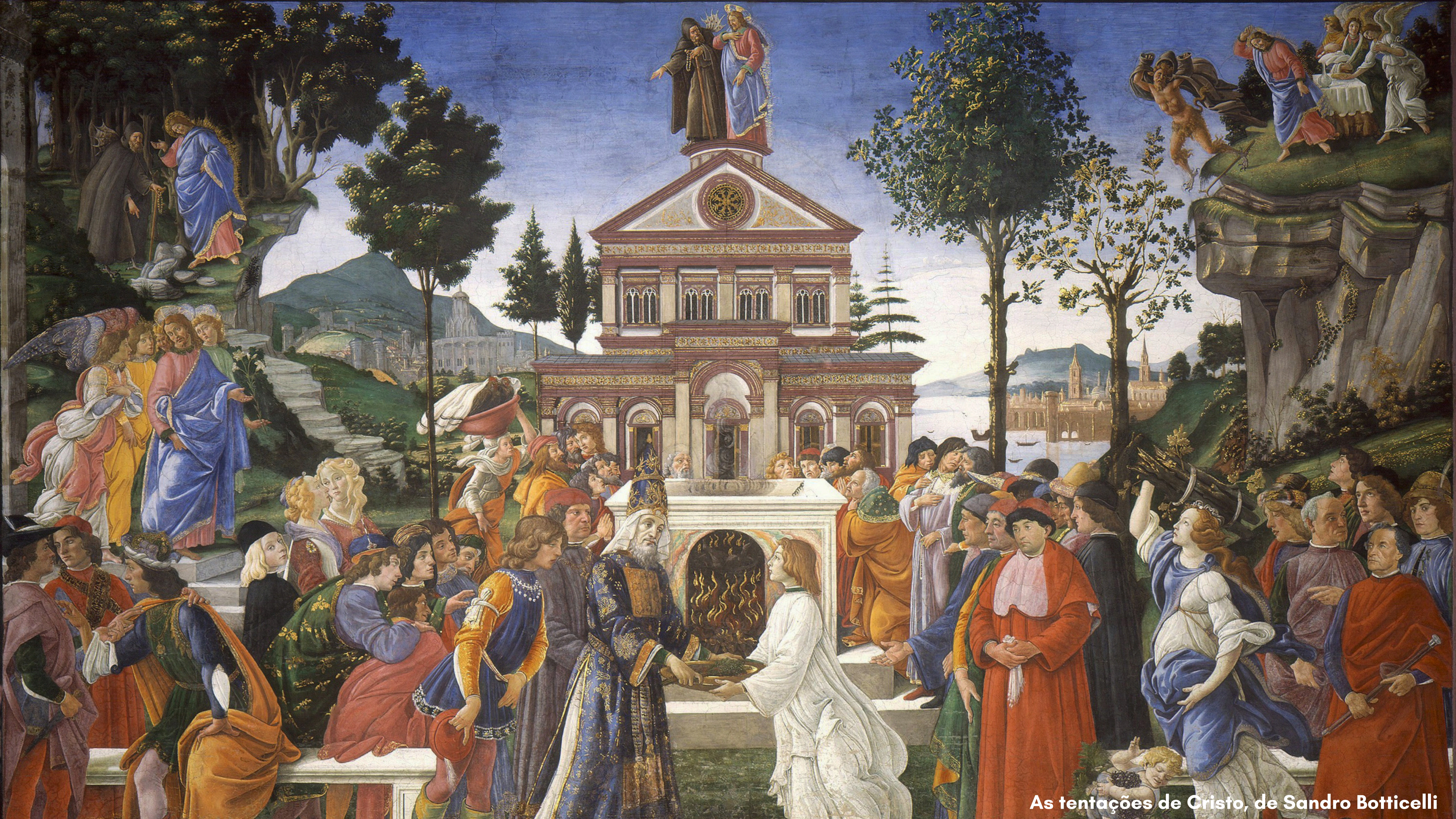
As tentações de Cristo, de Sandro Botticelli